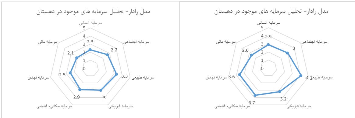
شکل ۷. نمودار راداری دهستان جون آباد