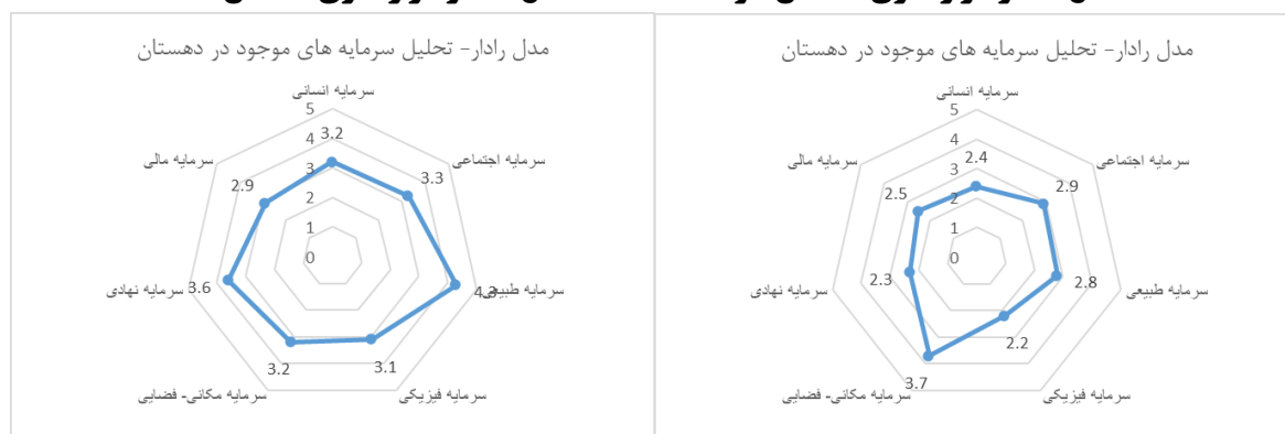
شکل ۵. نمودار راداری دهستان تمین