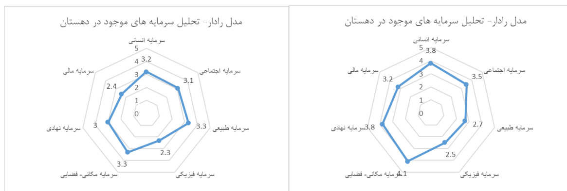
شکل ۳. نمودار راداری دهستان انده