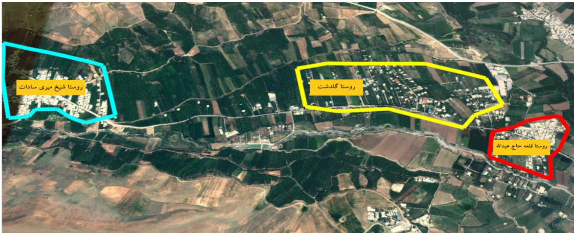
شکل ۳. منطقه روستا شهری گلدشت در سال ۱۳۹۰