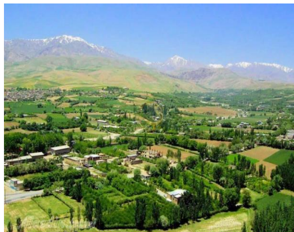
شکل ۵. تغییر چشم‌انداز روستا شهر گلدشت بر اثر ساخت خانه‌های دوم، مأخذ (نگارندگان: ۱۴۰۲)