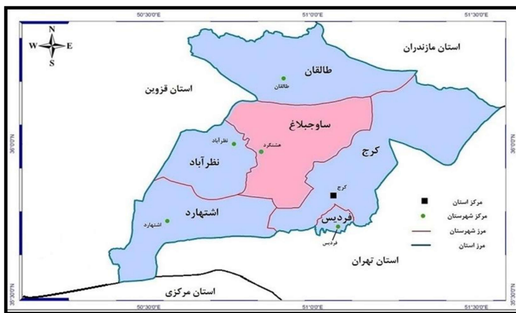
شکل ۲. نقشه شهرستان ساوجبلاغ استان البرز

داده‌های پژوهش از طریق مشاهده مشارکتی به صورت هدفمند با چند تن از اساتید دانشگاهی، کارشناسان و ذینفعان دارای تخصص اعم از مسئولین و افراد مطلع محلی و بر اساس اردوی علمی دانشگاهی با موضوع ساختار