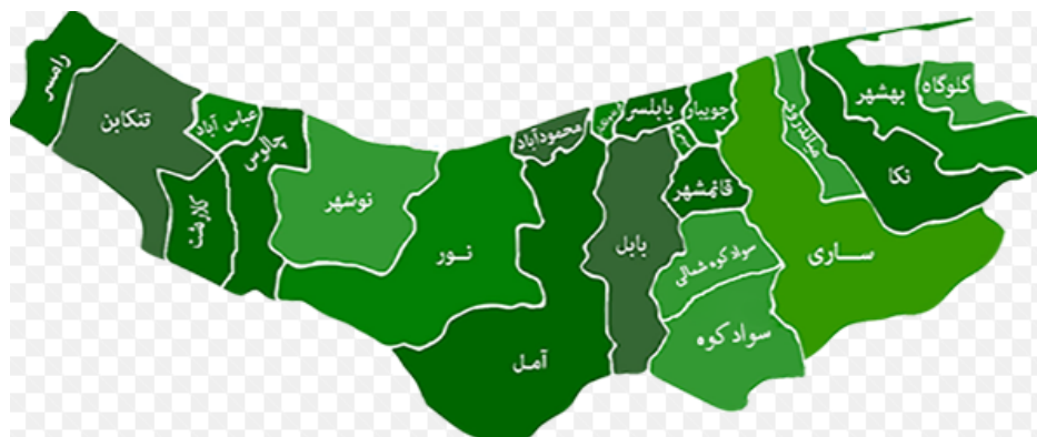
شکل شماره (۲) موقعیت شهرستان قائم شهر در استان مازندران

شهرستان قائم‌شهر در ۲۶ درجه و ۲۱ دقیقه تا ۳۶ درجه و ۳۸ دقیقه شمالی و ۵۲ درجه و ۴۳ دقیقه تا ۵۳ درجه و ۳ دقیقه طول شرقی از نصف النهار گرینویچ قرار گرفته است. این شهرستان ۴۵۸۵ کیلومتر مربع وسعت دارد. شهرستان قائم‌شهر از شمال به شهرستان جویبار، از جنوب به شهرستان سوادکوه، از شرق به شهرستان ساری و از غرب به شهرستان بابل محدود می‌شود. شهرستان قائم‌شهر دارای ۲ شهر، ۲ بخش، ۶ دهستان، ۱۵۶ آبادی دارای سکنه و ۳ آبادی خالی از سکنه است (استاندارداری استان مازندران، ۱۳۹۴). نقشه شماره ۱ موقعیت شهرستان قائم شهر را در استان مازندران نشان می‌دهد.