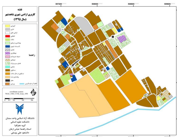
شکل شماره (۲) نقشه کاربری اراضی شاهد شهر در سال ۱۳۹۵