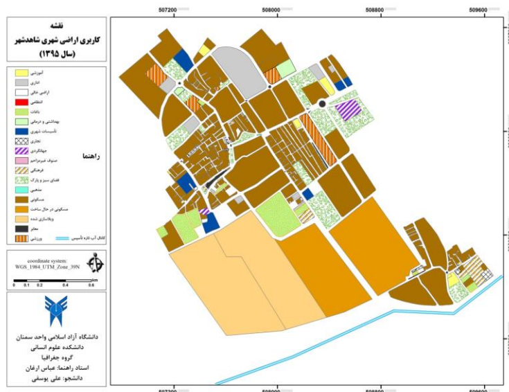
شکل شماره (۲) نقشه کاربری اراضی شاهد شهر در سال ۱۳۹۵