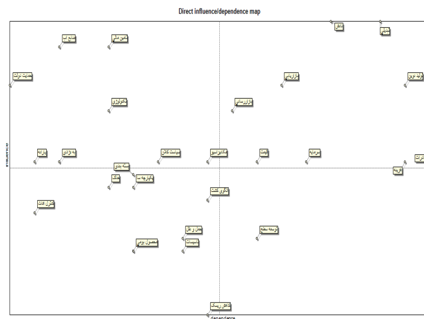
شکل ۱. نقشه پراکندگی متغیرها متناسب با میزان تأثیرگذاری و تأثیرپذیری آن‌ها در کشاورزی.

شکل ۱، نقشه پراکندگی متغیرها متناسب با میزان تأثیرگذاری و تأثیرپذیری آن‌ها در بخش کشاورزی استان نشان می‌دهد. این نقشه تأثیرات و وابستگی‌های مستقیم و غیرمستقیم میان متغیرها را نشان می‌دهد؛ که نشان‌دهنده میزان تأثیر و وابستگی بین آن‌ها را بیان می‌کند.