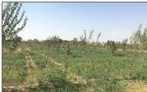
شکل ۳. تغییر کاربری شالیزار به باغ میوه در ناحیه لنجان سفلی

وجود آمده در فرایند تولید کشاورزی را به مثابه ناپایداری الگوی کشت ارزیابی می‌نمایند که پیامد آن تغییر و تخریب اراضی، تضعیف نظام اقتصاد کشاورزان و در نهایت افزایش مهاجرفرستی و تخلیه‌ی روستاهاست (شکل ۲ و ۳). درک تغییرات به وجود آمده به مثابه‌ی ناپایداری الگوی کشت در ناحیه روستایی لنجان در قالب یک مدل زمینه‌ای شامل عوامل تأثیرگذار / کنترل‌کننده، تأثیرات اولیه، پیامدهای اولیه و پیامد ثانویه در شکل ۴ ارائه شده است.