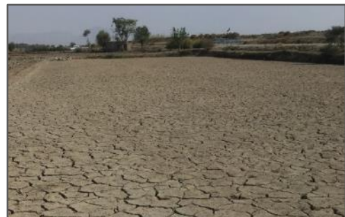
شکل ۲. عدم کشت و رهاسازی شالیزار در ناحیه لنجان علیا