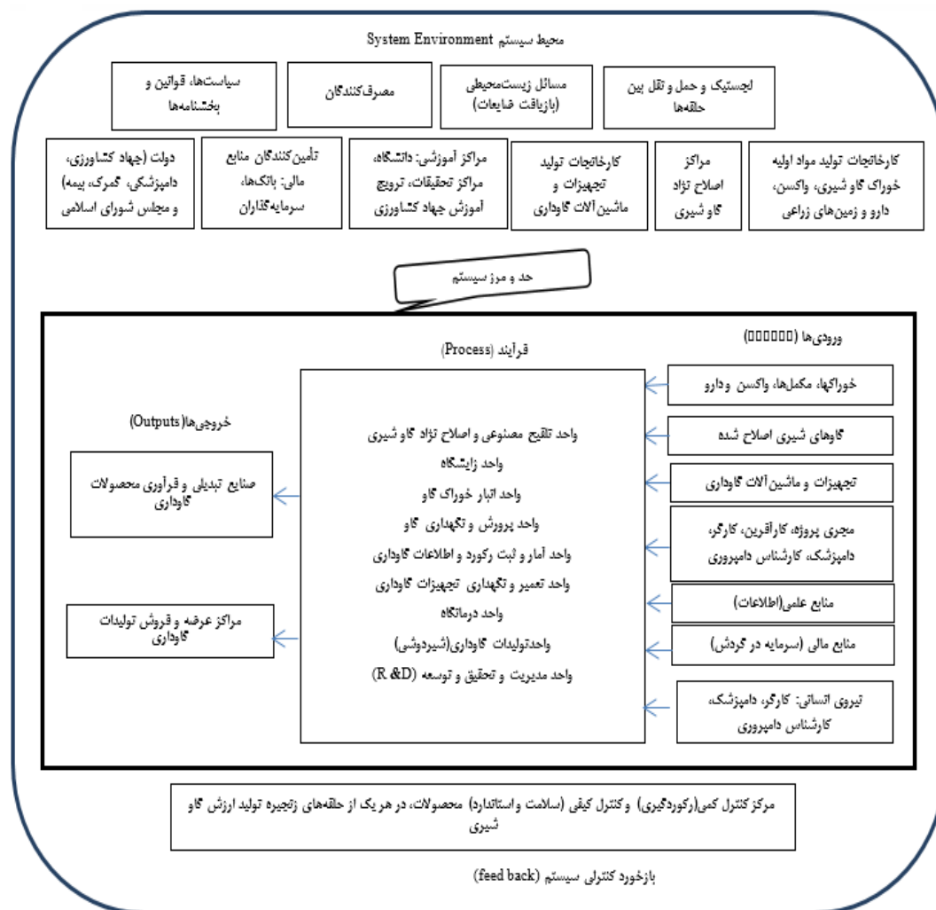
شکل ۱. مدل مفهومی تحقیق