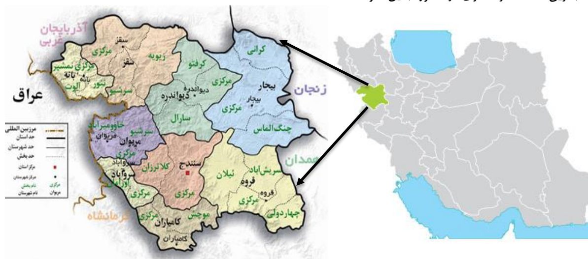
شکل ۲. موقعیت جغرافیایی محدوده مطالعاتی

استان کردستان یکی از استان‌های ایران به مرکزیت شهر سنندج است که در غرب کشور واقع شده است. مساحت این استان ۲۸۲۰۰ کیلومتر مربع معادل ۱/۷ درصد مساحت کل کشور ایران است. این استان که در دامنه‌ها و دشتهای پراکنده سلسله جبال زاگرس میانی قرار گرفته است، از شمال به استان‌های آذربایجان غربی و زنجان، از شرق به همدان و زنجان، از جنوب به استان کرمانشاه و از غرب به اقلیم کردستان و کشور عراق محدود است. استان کردستان با کشور عراق ۲۰۰ کیلومتر مرز مشترک دارد. استان کردستان براساس آخرین تقسیمات کشوری در سال ۱۳۹۰ دارای ۱۰ شهرستان، ۲۹ شهر، ۳۱ بخش، ۸۶ دهستان و ۱۶۹۷ آبادی دارای سکنه و ۱۸۷ آبادی خالی از سکنه بوده است. شهرستان‌های این استان عبارتند از: مریوان، بیجار، دهگلان، دیواندره، سروآباد، سقز، سنندج، قروه، کامیاران و بانه. بر پایه سرشماری عمومی نفوس و مسکن سال ۱۳۹۵ استان کردستان ۱۶۰۳۰۱۱ نفر جمعیت دارد که ۶۶ درصد شهری و ۳۴ درصد را جمعیت روستایی تشکیل می‌دهد. تراکم نسبی جمعیت معادل ۲/۵۱ نفر در کیلومتر مربع است. موقعیت جغرافیایی استان کردستان، آب‌وهوای مطبوع و طبیعی، وجود تفرجگاه‌های جنگلی، آبشارهای فصلی، صنایع دستی و سوغات محلی، مجاورت در مرز اقلیم کردستان عراق و وجود کالاهای خارجی ارزان قیمت، این استان را به یکی از جذاب‌ترین مقاصد گردشگری در کشور تبدیل نموده است.