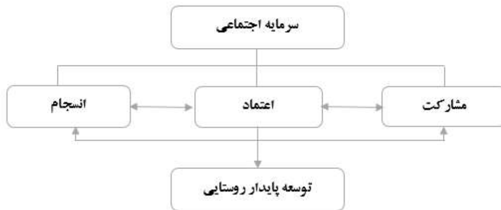
شکل ۱. مدل نظری پژوهش

اعتماد، هسته مرکزی بسیاری از مفاهیم کاربردی موجود در تئوری‌های علوم اجتماعی است که برای تبیین فرایندهای زندگی روزمره از جمله رضایت از زندگی، رونق اقتصادی، آموزش، رفاه، مشارکت، جامعه مدنی، دموکراسی، مردم سالاری و غیره به کار گرفته می‌شود (Delhey, Newton, & Welzel, 2011). در بررسی ادبیات جامعه‌شناختی مفهوم اعتماد به سه رهیافت فکری وجود دارد: اعتماد به منزله ویژگی فردی افراد، اعتماد به منزله عاملی در ارتباطات اجتماعی و نهایتاً هم اعتماد به عنوان ویژگی نظام اجتماعی با تأکید بر رفتار مبنی بر تعاملات و سوگیری‌ها در سطح فردی، مفهوم‌سازی شده است (Miszta, 2001). با عنایت به مفهوم سرمایه اجتماعی و ابعاد سه گانه آن مدل مفهومی تحقیق به شکل زیر ارائه می‌گردد.