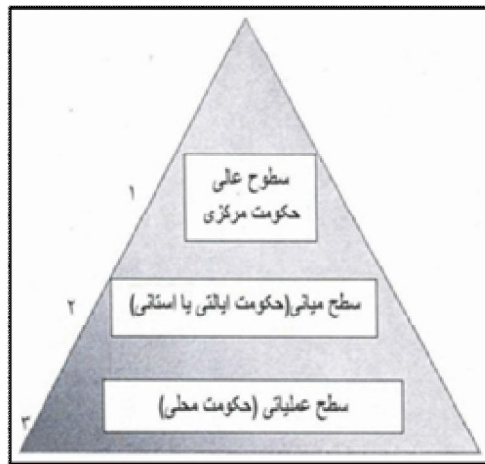
شکل شماره (۲): حوزه عملکرد شوراهای ایران (نصر، همان)