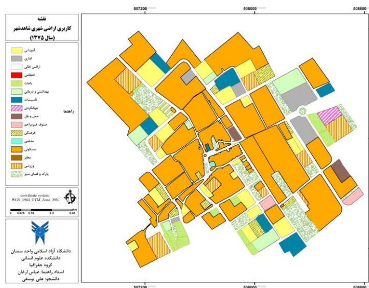
شکل شماره (۱) نقشه کاربری اراضی شاهد شهر در سال ۱۳۷۵