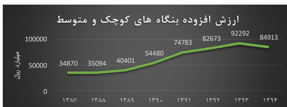
شکل ۱. نمودار ارزش افزوده بنگاه‌های کوچک و متوسط

ارزش افزوده کسب و کارهای کوچک و متوسط همانطور که در شکل (۱) ملاحظه می‌شود دارای روند صعودی از سال ۱۳۸۷ تا سال ۱۳۹۳ می‌باشد و تنها در سال ۱۳۹۴ به دلیل نرخ تورم و سایر نوسانات بازار کالا کاهش یافته است. به بیان دیگر می‌توان این گونه گفت که در تمامی سال‌های مورد بررسی روند ارزش افزوده، روندی صعودی بوده و تنها در سال آخر به دلیل تضعیف توان بنگاه‌های کوچک و متوسط دارای ارزش افزوده کاهشی بوده‌اند. ارزش افزوده در سال ۱۳۸۷ با رقم ۳۴,۸۷۰ میلیارد ریال شروع و تا سال ۱۳۹۳ حدود سه برابر و به رقم ۹۲,۲۹۲ میلیارد ریال رسیده است و با کاهش در سال ۱۳۹۴ به رقم ۸۴,۹۱۳ میلیارد ریال رسیده است.