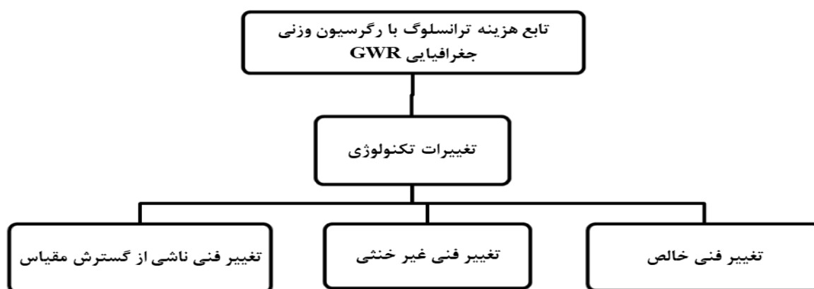
شکل ۱. مدل مفهومی پژوهش

چنین تغییر آریبی در تکنولوژی از تلاش‌های کارفرمایان سودجو برای کاهش هزینه‌های تولید به وسیله جایگزینی نهاده‌های نسبتاً ارزانتر به جای نهاده‌های گرانتر ناشی می‌گردد (Hayami & Ruttan, 1970). چنانچه ملاحظه می‌شود طبق نظریه هیکس، تغییر در قیمت‌های نسبی عوامل، تمایلی برای یک تغییر فنی کارافزا یا سرمایه افزا القا می‌کند و این تغییر فنی القا شده قاعدتاً تعادل‌های اقتصادی را متأثر می‌سازد. به همین دلیل در این مطالعه بر مفهوم به کار رفته توسط هیکس تأکید بیشتری می‌گردد (یاوری و دشتی، ۱۳۸۸: ۱۴۹). بنابراین بر اساس مبانی فوق مدل نظری تحقیق به صورت زیر ترسیم می‌گردد.