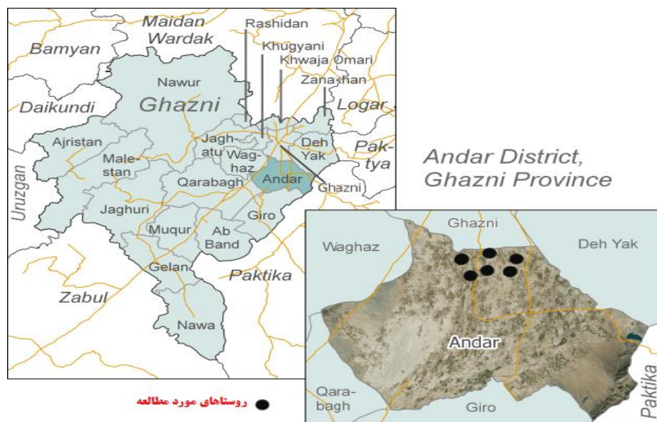
شکل ۱. موقعیت جغرافیایی محدوده مورد مطالعه در کشور افغانستان، استان غزنی، شهرستان اندر