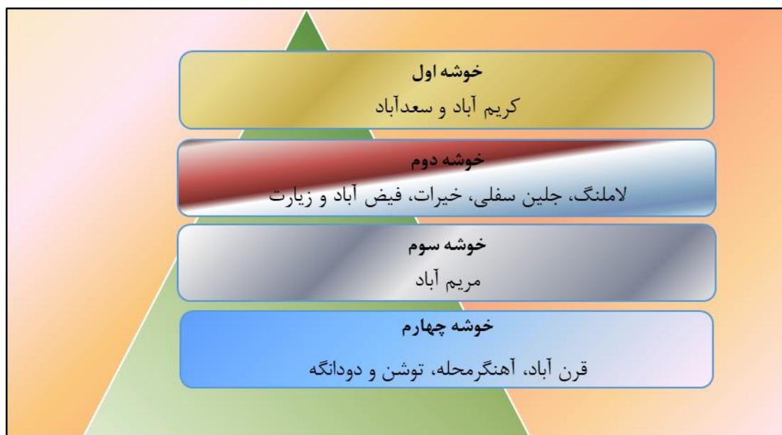
شکل ۴. میزان ظرفیت کشت هیدروپونیک در روستاهای مورد مطالعه با استفاده از مدل تحلیل خوشه‌ای سلسله‌مراتبی