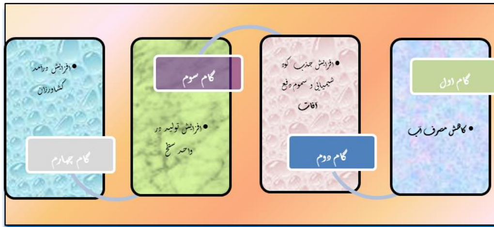
شکل ۳. اثرات کشت هیدروپونیک

الگوریتم خوشه‌ای کردن روستاها به منظور ظرفیت‌سنجی کشت هیدروپونیک با روش تحلیل خوشه-ای