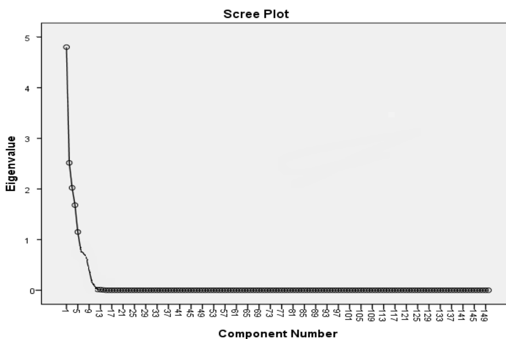
شکل ۵. نمودار سنگریزه‌ای

شکل (۵) به نمودار سنگریزه‌ای موسوم است و عامل‌های با مقدار ویژه بالای یا همان الگوهای ذهنی را نشان می‌دهد که پنج عامل یا الگوی ذهنی مشاهده می‌شود. جدول (۵) ماتریس چرخش یافته عامل‌ها نمایش داده شده است. در این ماتریس افرادی که در هر یک از این پنج الگوی ذهنی قرار می‌گیرند مشخص شده‌اند.