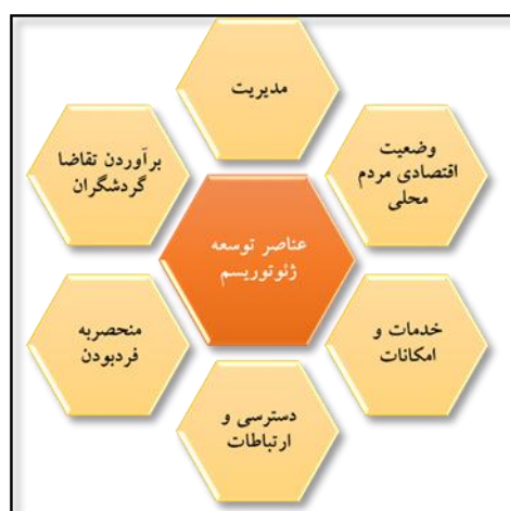
شکل ۱. عناصر اصلی اثرگذار بر توسعه ژئوتوریسم در مقاصد از دیدگاه گنتینگ و فبری.

پایدار جوامع محلی خواهد بود (Wéber et al, 2015:318). روچا و سیلوا (۲۰۱۴)، بیان می‌کنند؛ زمانی که از توسعه ژئوتوریسم، سخن گفته می‌شود؛ یکی از محورهای اصلی آن ارزش‌های طبیعی و جاذبه‌های آن بوده و محور بعدی آن، مرتبط با مطلوبیت وضعیت مدیریت، خدمات و امکانات، پشتیبانی مالی، ارائه بسته‌های متنوع به ژئوتوریست‌ها، سازماندهی و ارتباطات گروه‌ها و بازیگران درگیر، رضایت گردشگران، وضعیت حفاظت، بهره‌مندی اقتصادی جامعه محلی، ارتباط مردم محلی با ژئوتوریست‌ها و پذیرش آنها خواهد بود (Rocha and Silva, 2014:744). گنتینگ و فبری (۲۰۱۸) نیز، لازمه موفقیت و اثرگذاری ژئوتوریسم را در مطلوبیت عناصر اثرگذار آورده شده در شکل زیر می‌دانند (Ginting and Febri, 2018:2).